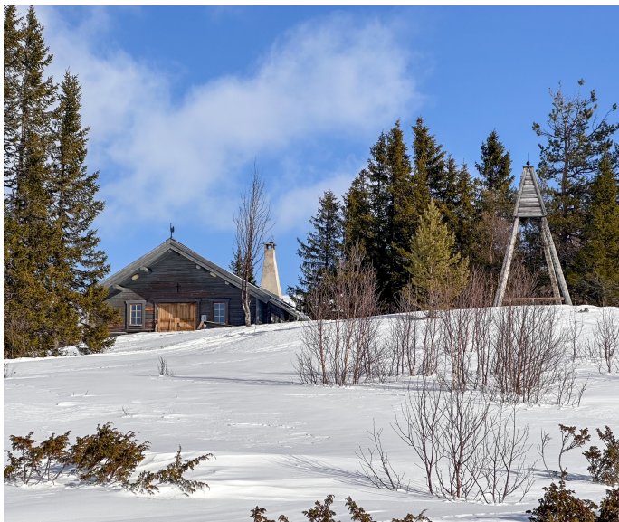
Mars 2025 - kapellet med mindre snö än vanligt

Något nytt har inte kommit från Bergs kommun/Vatten och Miljöresurs angående den framtida sopsorteringen, utan vi sorterar som vanligt till vi får något besked.