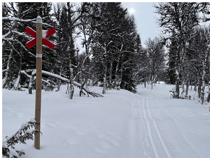
Mars 2025 - ospårat efter nattens snöfall på leden upp mot Hundshögen.

Vi vädjar att ni åker så lite som möjligt på sidan om de befintliga sommarvägarna.