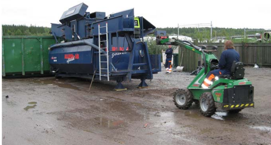
Bild 3. Kärn lastas i latrinmaskin.

Bild 2. Av kommunen godkänd behållare för latrin