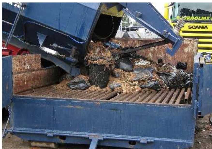
Bild 4. Svårhanterad rest som måste eftersorteras för att få bort plasten.

Det är viktigt att latrinbehållaren inte innehåller plastpåsar eller annat avfall som medför problem vid- eller omöjliggör tömningen och behandlingen av latrinet.